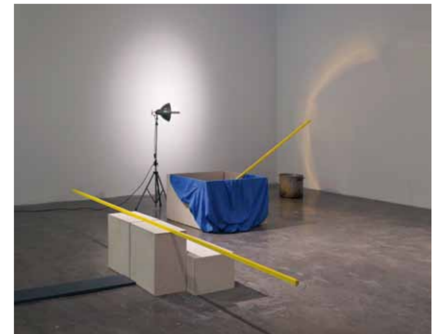
This page and opposite – Geoffrey Farmer and Jeremy Millar, "Mondegreen", installation views, Project Arts Centre, Dublin, 2011.