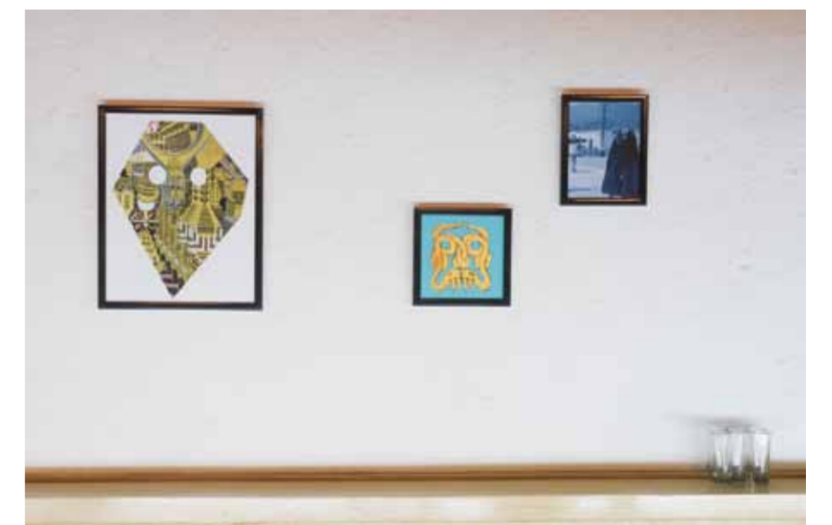
“The Vampire Of Coyacan And His Twenty Achichintles”, installation view, Museo Experimental El Eco, Mexico City, 2010.