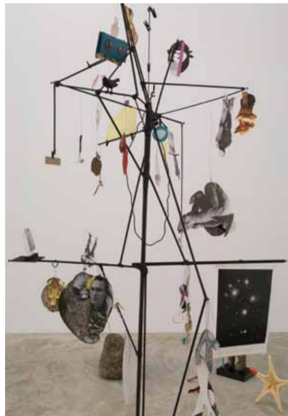
The Quasi-Cameraman (Make Picture Of Kaleidoscope), 2010

gf: I don’t know if I ever want those two gestures to be reconciled. In a piece like The Last Two Million Years , there is what you see and what you read. They don’t necessarily match up. The small newspaper book that accompanies the piece has texts correlating numerically to the grouping of the historical cut-outs. The texts are a mixture of a more subjective and sometime humorous statements and historical description that have more pathos: