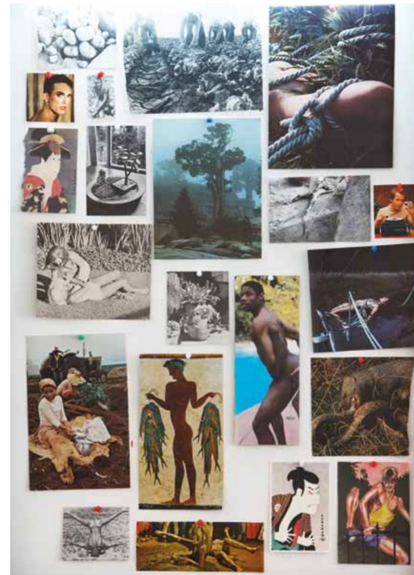
Left and below – Let’s Make the Water Turn Black (details), installation views, REDCAT, Los Angeles, 2011.

gf: I want to be cynically optimistic (in the true sense of the term – cynic coming from canine ). If I had to choose a machine to illustrate this, it would be one of those contraptions people make so they don’t have to put their dogs down when their dogs lose the use of their hind legs. You know those little dog wheelchairs.