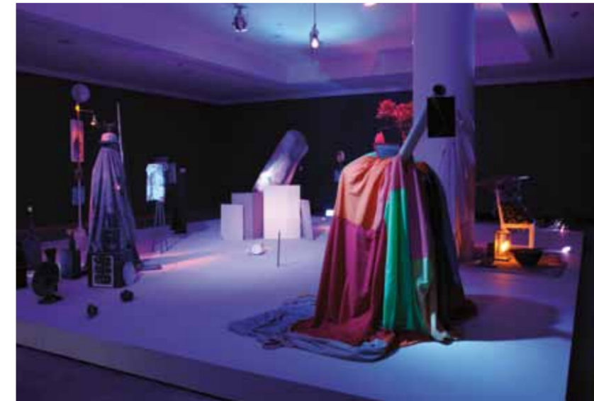
This page and opposite – "Let's Make the Water Turn Black", installation view, REDCAT, Los Angeles, 2011.