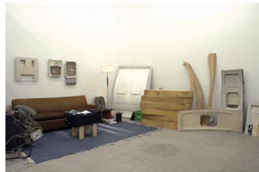
This page, unless otherwise specified – Airliner Open Studio , installation view, Catriona Jeffries Gallery, Vancouver, 2006.