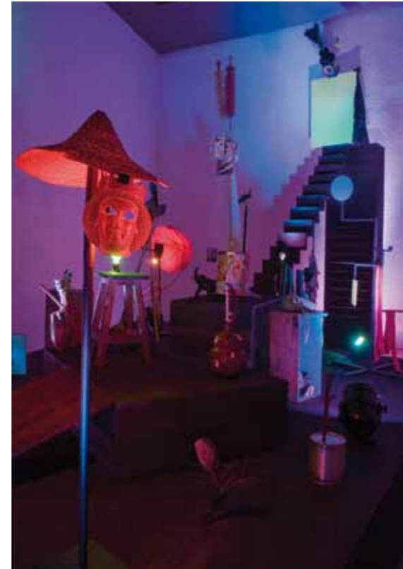
“The Vampire Of Coyacan And His Twenty Achichintles”, installation view, Museo Experimental El Eco, Mexico City, 2010.

ms: I’m also curious, what do you think will become of Let’s Make The Water Turn Black and Aloysius Snuffleupagus in the next say two years?