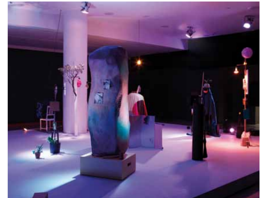
Let's Make the Water Turn Black , installation view, REDCAT, Los Angeles, 2011.

gf : Non per continuare a battere sullo stesso tasto, ma Snuffleupagus sarebbe dovuto rimanere immaginario. So che è importante che vi sia un consenso col-