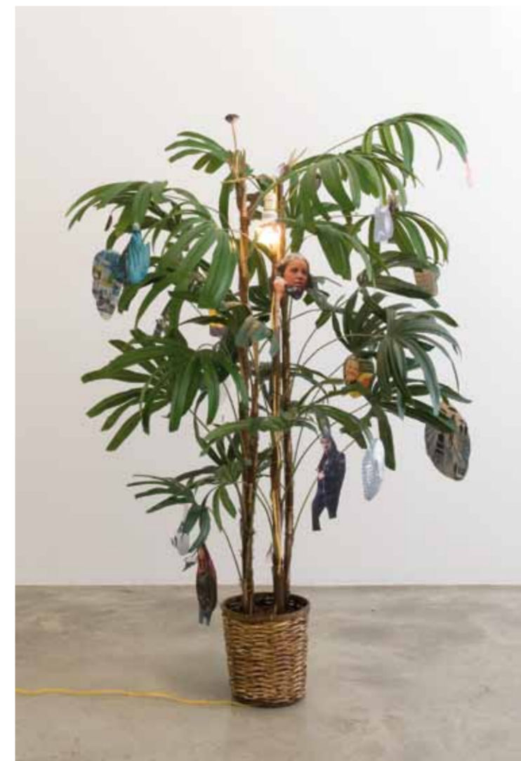
I am by nature one and also many, dividing the single me into many, and even opposing them as great and small, light and dark, and in ten thousand other ways , 2010.